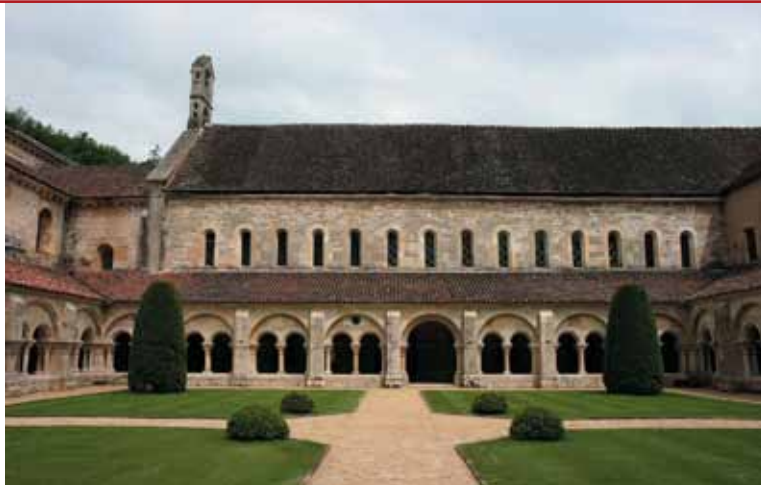
Fontenay, ciszterci apátság ↑

Nézzük hát meg, hogy mi is jellemző tehát a ciszterciekre és építészetükre: először is szembe tűnő különbség, hogy amíg a bencés monostorok túlnyomó részt hegyekre, hegytetőkre épültek, a ciszterciek a völgyeket részesítették előnyben. Ez az alapelv tevékenységükből is fakad: ahogy említettük, a ciszterci reformnak fontos eleme volt a fizikai munka hangsúlyos szerepe a szerzetesi életben (olyannyira, hogy emiatt jelentősen egyszerűsítették, rövidítették a zsolozsma rendjén is). Éppen ezért alapításaiknak a lakott területektől távoli, valóban kietlen területeken találnak helyet. Különösen jelentős a rend tevékenysége a feltöretlen földek, terméketlen területek termővé alakításá-